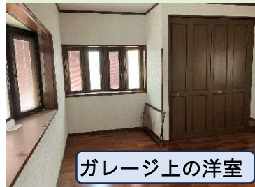
ガレージ上の洋室